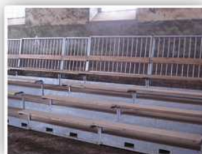
Passage de fourches