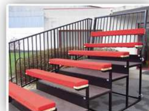
Banquette rembourrée en velours